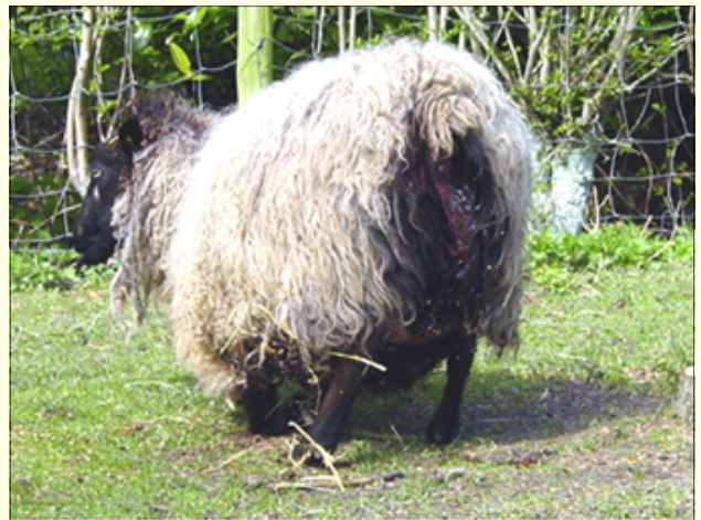
Opstaan, liggen, opstaan, draaien, ruiken, krabben. Daarna begint het hele ritueel weer van voor af aan.

Het contactadres = antonetvonken@vssschapen.nl of 0495 49 57 21.