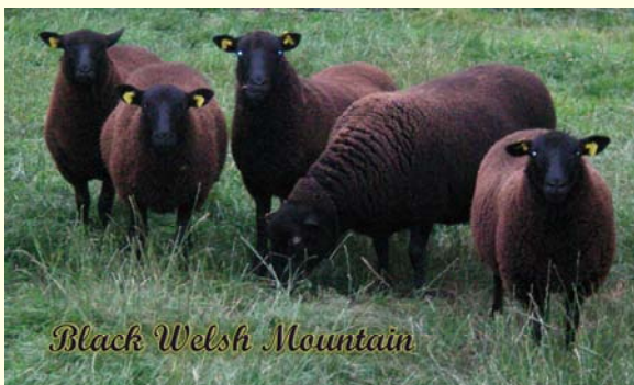
Black Welsh Mountain

Toen iedereen verzadigd was en een luchtje had geschept kregen we uitleg over het bedrijf, over de verschillende schapen en de verschillen van de wol. Ook kregen we mooie werkstukken te zien die van de wol waren gemaakt. Hierna was het tijd voor de rondleiding. We gingen eerst naar de lammeren die binnen stonden en de schapen die bij de boerderij liepen. Daarna mochten we in de huifkar om de verschillende schapenrassen buiten te kunnen zien. Er was even een probleempje: de tractor wilde niet starten. Hier moest een auto en een startkabel aan te pas komen.