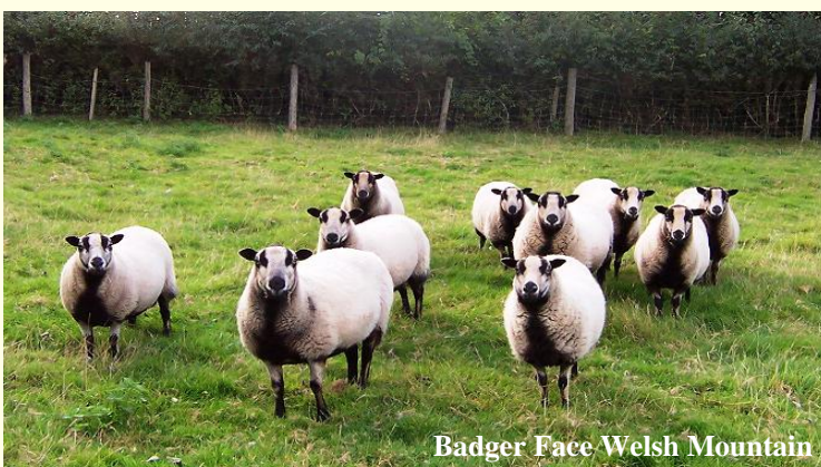
Badger Face Welsh Mountain